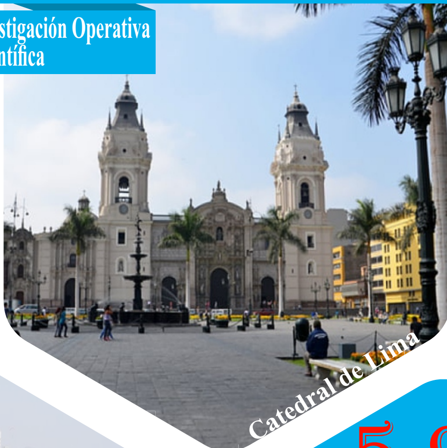
Catedral de Lima